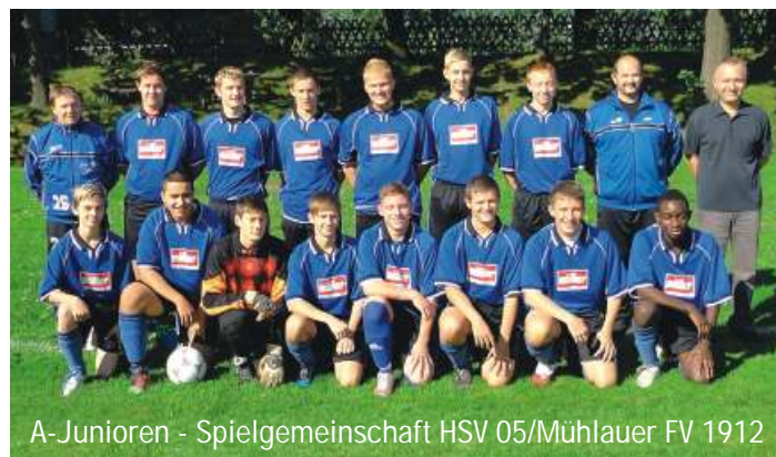
A-Junioren - Spielgemeinschaft HSV 05/Mühlauer FV 1912